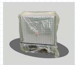
カバーとして使用時

『Zerust® と、黄色い防錆フィルムは、Northern technologies International(NTIC) と大洋シーアイエス株式会社の登録商標です。』