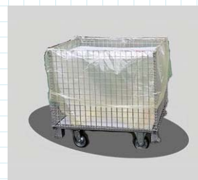
内袋として使用時