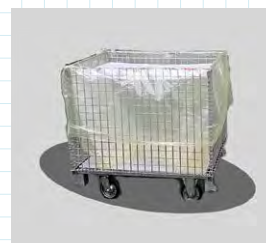
内袋として使用時