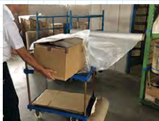
1. フィルムを出して入れる