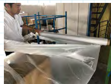
4. ミシン目でカットする