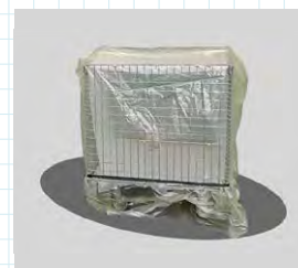
カバーとして使用時